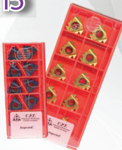
Příklad objednávky: 16ER3.0ISOBLU + 22ER6ABUTMXC 5 x 16ER3.0ISOBLU ZDARMA