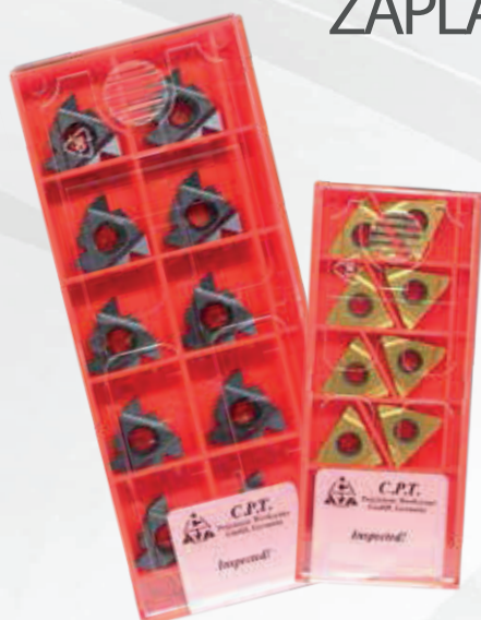
Příklad objednávky: 22ERN60BMA + 16ER28UNMXC 5 x 16ER28UNMXC ZDARMA

KUP 20 ZÁVITOVÝCH DESTIČEK (balení 10 kusů) ZAPLAŤ POUZE 15